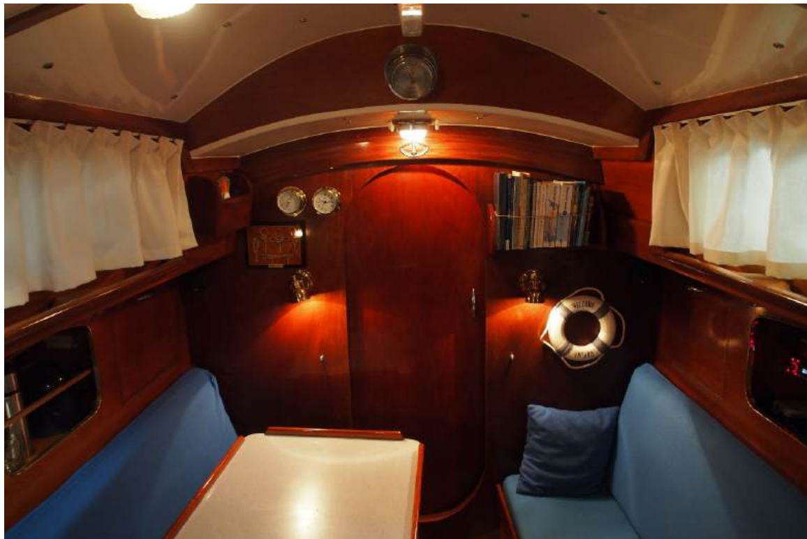
Foto zusterschip BN 410