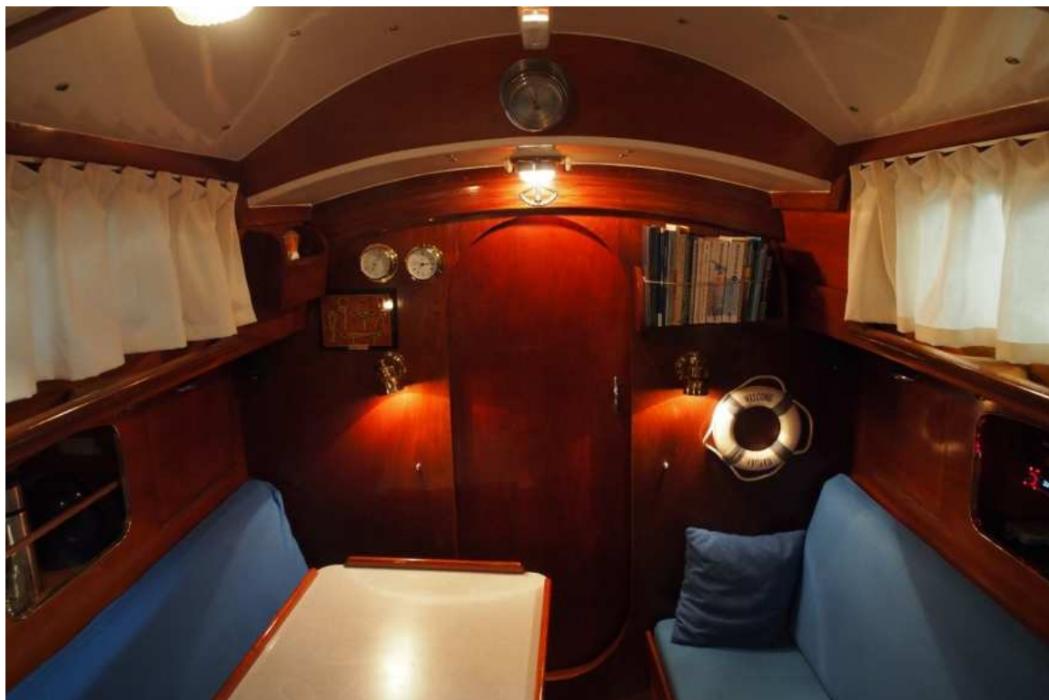
Foto zusterschip BN 410