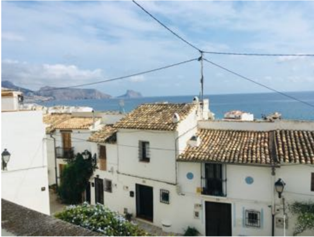
Altea met Calpe in de achtergrond

Na twee nachten Altea op woensdag met een stevig windje de 25 mijl naar Javea gevaren. Imposant is Cabo de la Nau met haar vuurtoren. Overigens in deze drie weken in Spanje slecht een keer een bui gehad, soms wat bewolking maar vrijwel elke dag zonnig en rond de 28 graden. Navigeren is in deze streken eenvoudig. Over het algemeen goed zicht en overal genoeg water onder de kiel. De windkracht en richting kan wel plotseling en soms onvoorspelbaar wijzigen. Wanneer deze dan aanlandig is kun je binnen korte tijd een rustige ankerplek zien veranderen in een ruwe zee met behoorlijk stijlen golven.