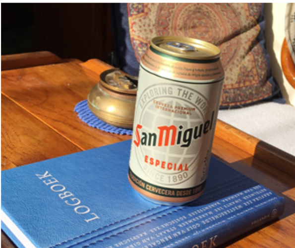
Terug in Spanje

In Alicante was het rustig. Weinig, voornamelijk Spaanse toeristen. Iedereen, met uitzondering van de “joggers” draagt op straat en in de winkels een mondkapje. Alleen aan tafel met een drankje of bij de maaltijd mag het kapje af.