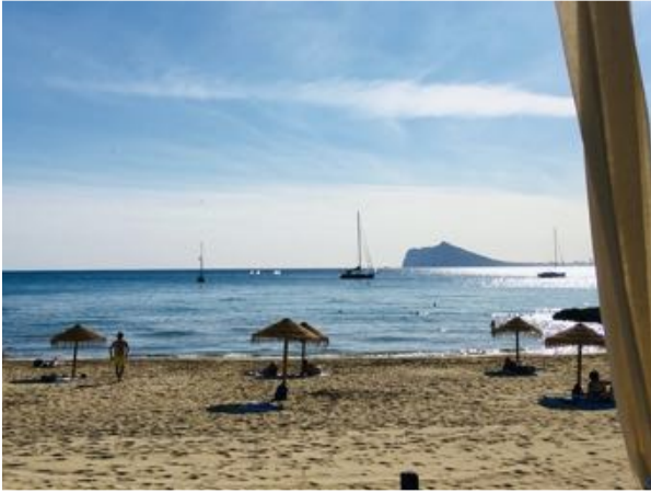
Strand Calpe, parasols op Corona afstand

gezeild naar Alicante. Om 18 uur lag “Ros Beyaert” weer in de box. In Alicante heeft de haven zijsteigers en is het eenvoudig om in je vaste box af te meren, zelfs solo. De marineros hoeven wij in onze thuishaven niet te storen.