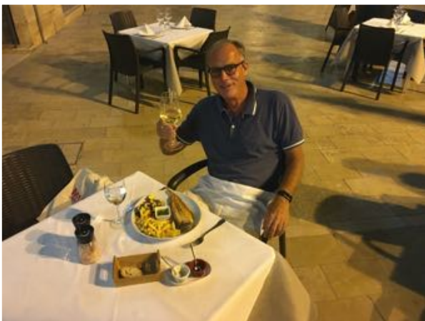
Plaza 6 Alicante voor de terugvlucht

Ook nu weer met de subplank naar de wal gepeddeld. Het was er vrijwel uitgestorven. Een biertje kon ik krijgen maar op één restaurantje na was alles gesloten. Corona was nog nooit zo zichtbaar voor mij geweest in Spanje. Het plan om er de nacht te blijven liggen heb ik laten varen.