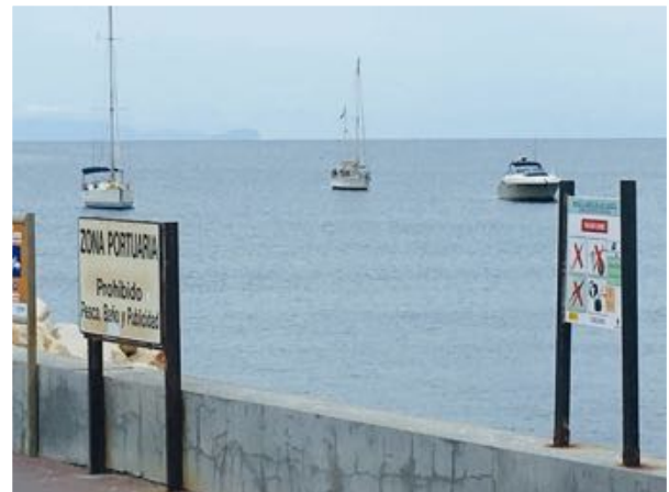
Voor anker Tabarca

De wind trok flink aan, van Villajoyosa heerlijk