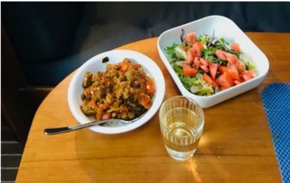
Nasi Goreng met Conimex kruiden

In stad en haven was het nog rustiger dan in Juli. De meeste restaurants waren nog open. De discipline om mondkapjes te dragen was onverminderd groot, de continue aanwezigheid van de Guardia Civil droeg daar mogelijk toe bij. Zeilen is geen probleem, je bent in alle havens welkom, mits met niet te veel personen aan boord. Als solozeiler ben je natuurlijk helemaal ok.