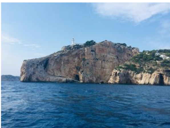
Cabo de la Nau

zonnebril en droge kleren naar het strand gepeddeld.