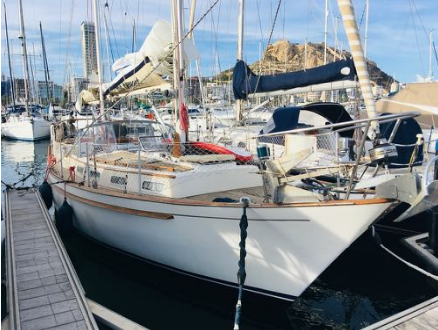
Ros Beyaert in Alicante

In de week voor onze vlucht naar Alicante kleurde Spanje van code Oranje naar Rood, alleen noodzakelijk reizen. De vluchten boekte ik, wat optimistisch, om naar 28 december.