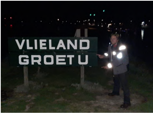
Foto 2 Selfie op Vlieland

Den Helder; los de puzzel op. Minimaal 2 uur ankeren. Pioniersstraat 1 in Lelystad; los de puzzel op en extra opdracht. Per etmaal moet 7 uur rust worden gehouden en alles moet worden gezeild. Pas na de havenhoofden gaat de motor aan. Alle zeiltijden moeten worden bijgehouden en er wordt een handgeschreven logboek verwacht.