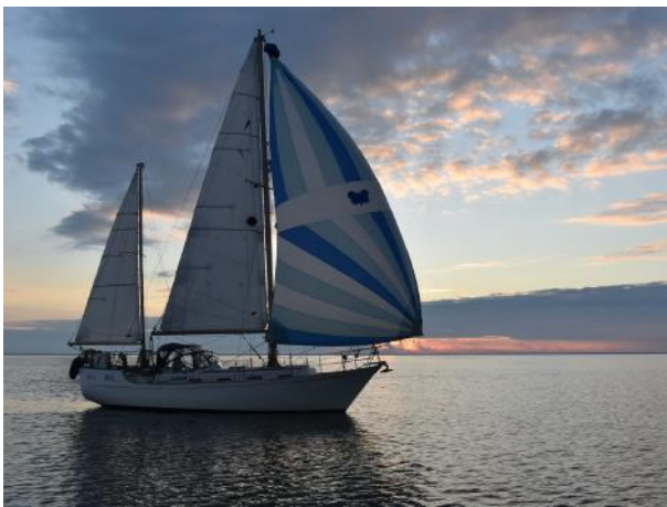
Foto 1 Sangha bij Enkhuizen

Zomaar een mooie foto van een Trintella 3a op een late namiddag in oktober, in de buurt van Enkhuizen. Wat een relaxed beeld, zouden ze lekker eten koken ondertussen, misschien is dit het laatste tripje voor de winterstalling?