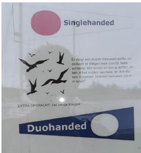
Foto 6 Opdracht Makkum

0900. Zuidwest 4-5. Het tij is zo vriendelijk om rekening te houden met een normale maandagochtend ontbijttijd. Met een zalige stroom mee, een bijna compleet bezeilde koers en een waterig zonnetje zeilen we in recordtijd naar Harlingen. Wow dat is waar we het voor doen. Een prachtige tocht over een bijna verlaten Waddenzee. De Boontjes hebben we echter pal tegen. Pas over een uur gaat de stroom mee staan. Wachten en daarna kruisen? Eigenlijk willen we opschieten om vandaag zo ver mogelijk te komen. Morgen wordt het zuid 7/8. Oké we kiezen weer voor de pk's. Om ons heen zwermen dappere deelnemers tegen wind en stroom eindeloos zigzaggend de super smalle Boontjes af. Het kevlar klappert ons continue om de oren. Petje af. Doordouwers zijn het! Maar ja zij kunnen wel een flink stuk hoger aan de wind varen.