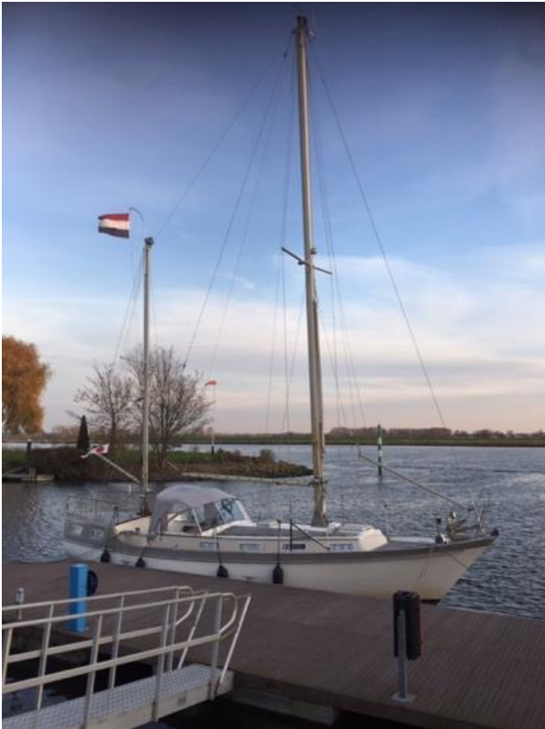
WSV Blinckvliet aan het Spui

Navraag had geleerd dat in de winterperiode voor de bediening van de Haringvlietbrug een verzoek moet worden gedaan bij Rijkswaterstaat, waarbij meteen wordt gecheckt of er op de vervolgroute geen stremmingen zijn. De eerste vaardag was droog maar erg koud. Rond 4 uur arriveerde ik in Steenbergse Vliet. Vroeg naar bed, na de Chinees, om bijtijds te vertrekken naar Zierikzee.