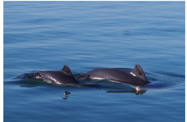
Bruinvissen in de Oosterschelde

Na wat heen en weer varen voor Zierikzee voeren we nog even langs Studio Bruinvis. Deze bestaat uit een gele boei naast de haven en wordt gehoord door Rugvin. Aan de ton is een hydrofoon bevestigd die het geluid van in de buurt zwemmende bruinvissen doorzendt naar een zuil op het havenhoofd van Zierikzee. Door “omzetting” van het geluid voor het menselijk gehoor, zijn de geluiden hoorbaar als de knop op de zuil wordt ingedrukt.