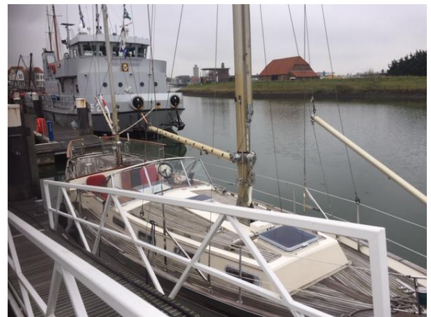
Marineschip en de Limelight