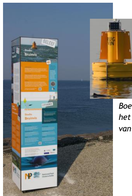
Boei en zuil op het havenhoofd van Zierikzee

Na wat heen en weer varen voor Zierikzee voeren we nog even langs Studio Bruinvis. Deze bestaat uit een gele boei naast de haven en wordt gehoord door Rugvin. Aan de ton is een hydrofoon bevestigd die het geluid van in de buurt zwemmende bruinvissen doorzendt naar een zuil op het havenhoofd van Zierikzee. Door “omzetting” van het geluid voor het menselijk gehoor, zijn de geluiden hoorbaar als de knop op de zuil wordt ingedrukt.