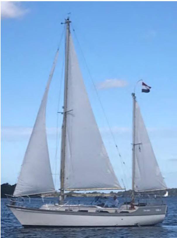
De Limelight, Trintella IIIa