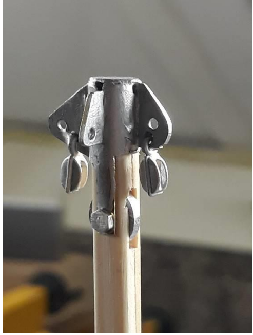
Masttop beslag (messing) voor het houten mastje.