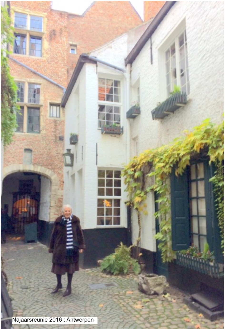
Najaarsreunie 2016 : Antwerpen