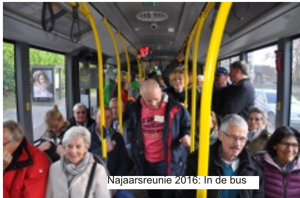
Najaarsreunie 2016: In de bus

Het middagprogramma bestond uit een rondrit met een toeristentrammetje langs de hoogtepunten van de Antwerpse architectuur. Ik hoorde iemand zeggen dit soort trammetjes altijd te rijden, maar dit was wel een leuk trammetje. We zaten niet op bankjes achter elkaar, maar in een grote cirkel (rondzit), hetgeen voor het onderling contact en gezellig gepraat heel geschikt was. Niet alles wat de gids vertelde werd met evenveel aandacht aangehoord, maar we kregen toch