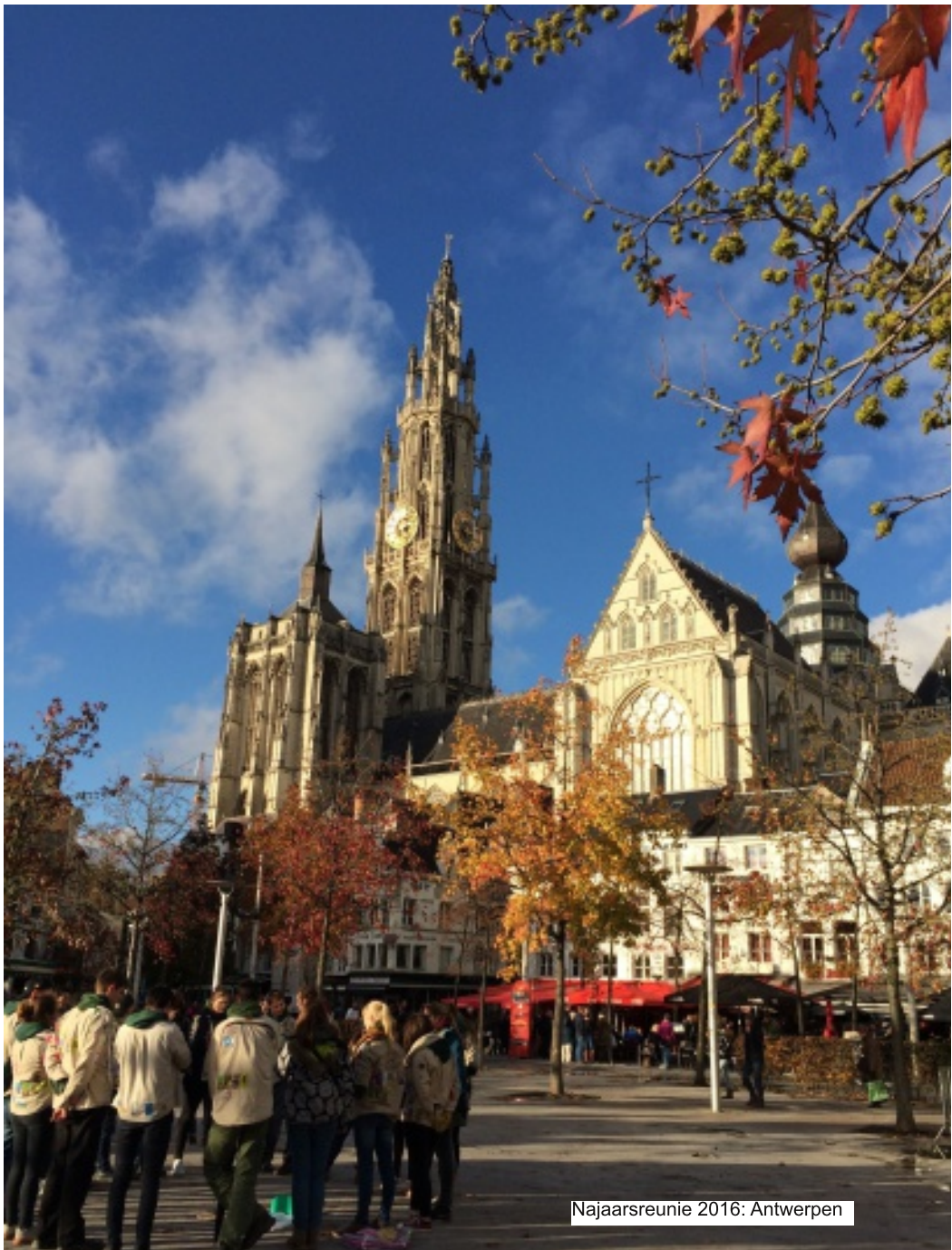
Najaarsreunie 2016: Antwerpen