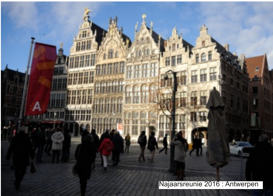
Najaarsreunie 2016 : Antwerpen