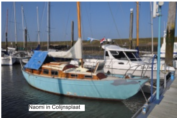
Naomi in Colijnsplaat

Is er een tweede leven mogelijk voor deze Trintel I, de "Naomi" uit 1963?