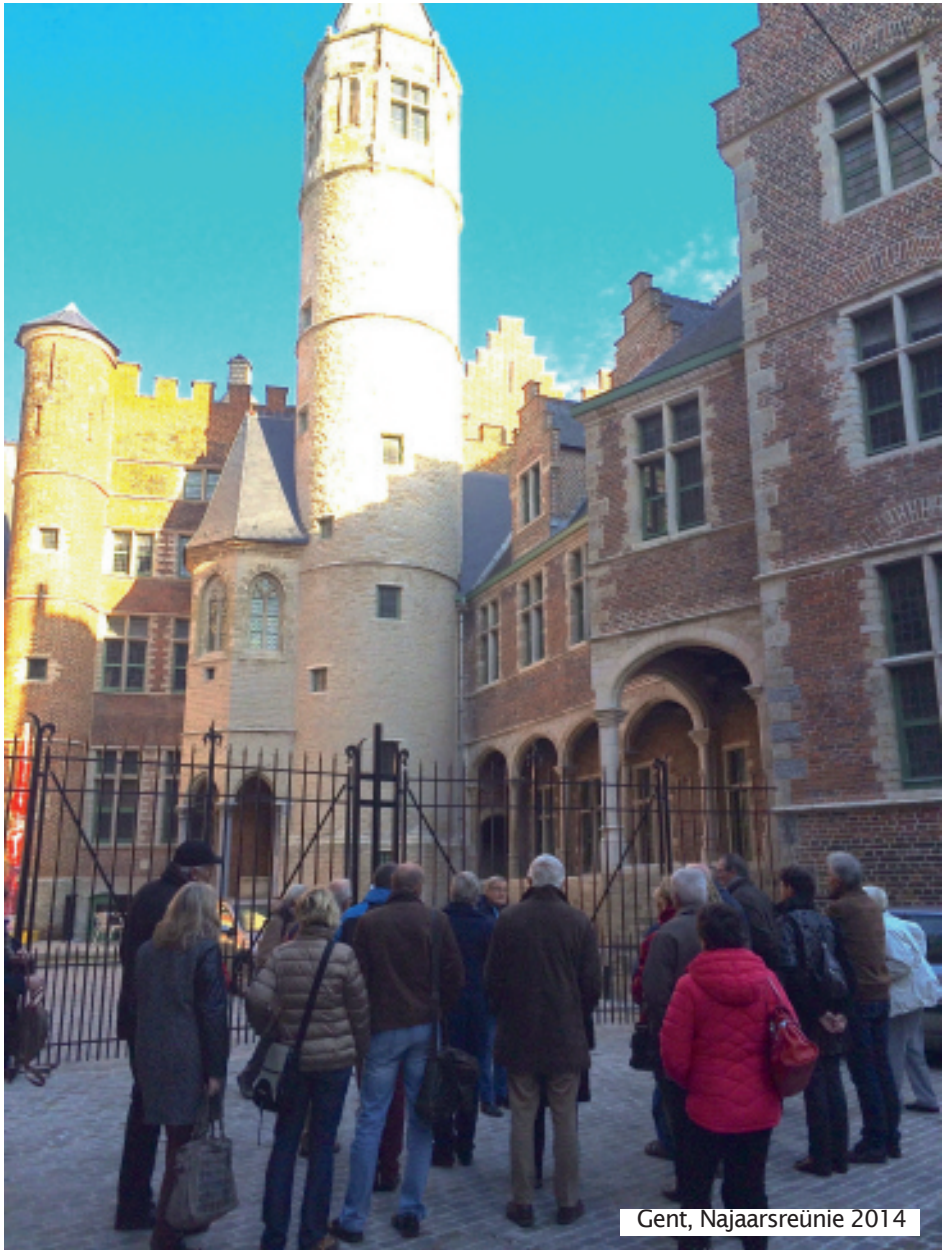
Gent, Najaarsreünie 2014