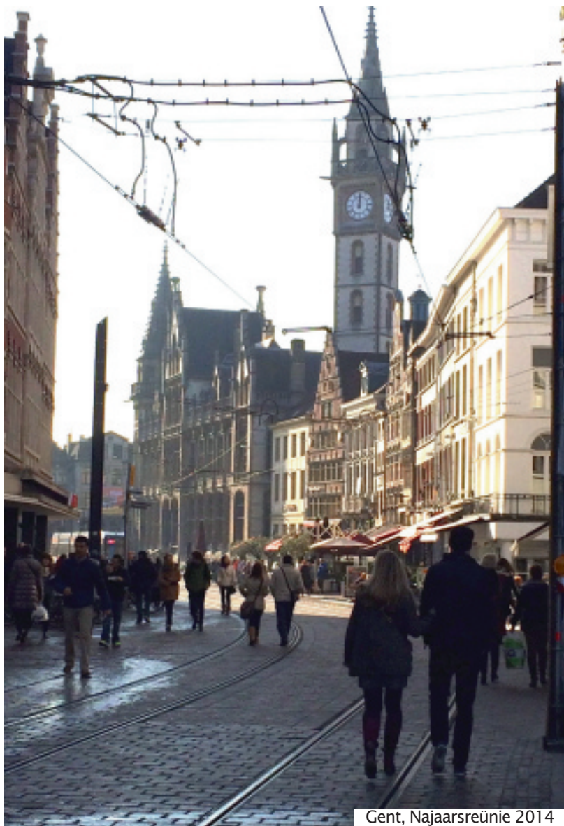
Gent, Najaarsreünie 2014