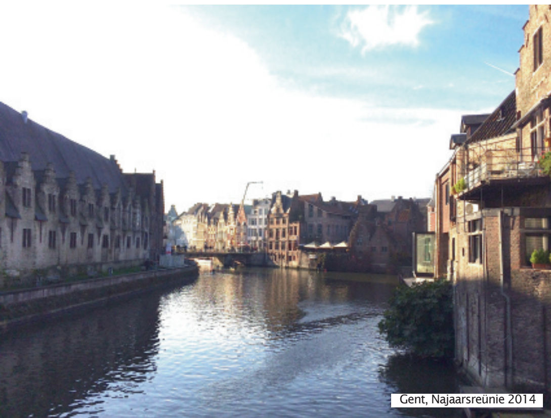
Gent, Najaarsreünie 2014