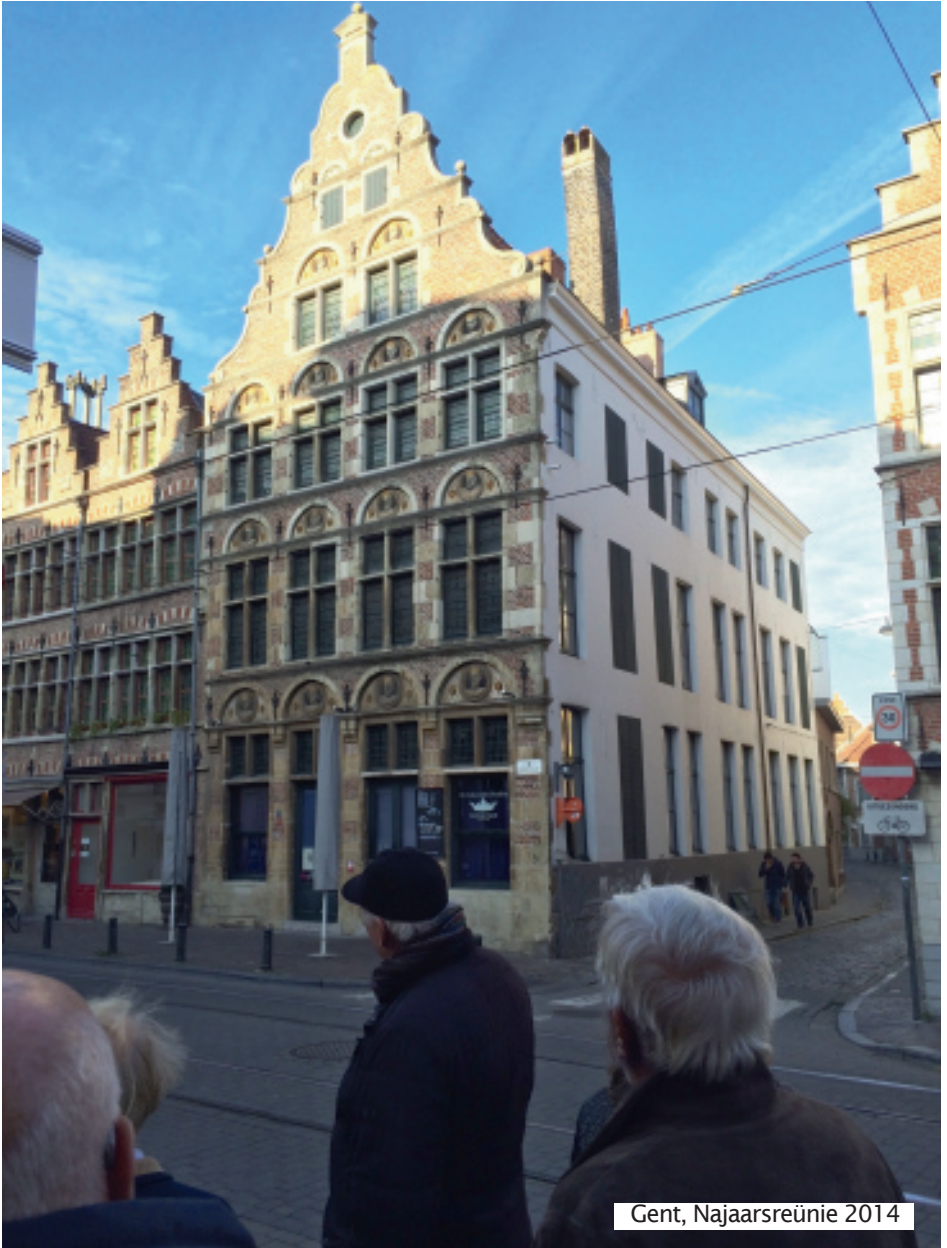
Gent, Najaarsreünie 2014