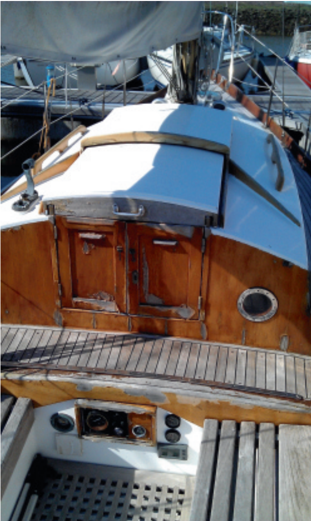
Verpieteren aan de Oosterschelde