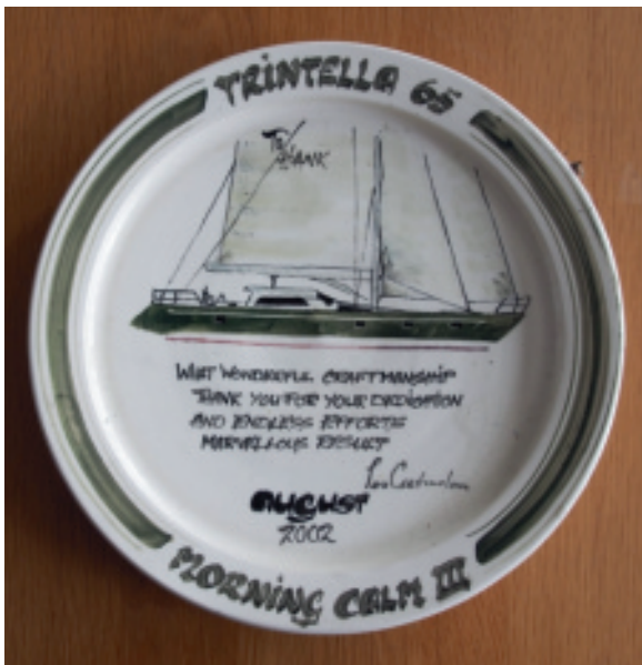
Een blijk van waardering voor zijn vakmanschap na het afbouwen van een Trintella 65C

Later toen er andere interieurarchitecten dan Van de Stadt werden gebruikt, werd er meer een lichte radius in de interieurs toegepast. Deze waren zeer moeilijk te maken en zeer arbeidsintensief. Dan werd er gebruik gemaakt van een kostbare vacuüm techniek