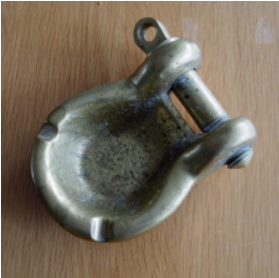
Een zwaar in massief messing uitgevoerde asbak die aan de medewerkers van de werf werd uitgereikt ter gelegenheid van Bouwnummer 1000 in 1978

Een heel apart en modern interieur heb ik eens gemaakt voor een Trintella 42 waarvan de eigenaren uit de modewereld een heel licht gelakt interieur wilden, gedecoreerd met waterdruppels.