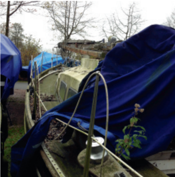
Trintel 1: nog niet te laat!

Technische bootinformatie gaan wij per categorie concentreren en toegankelijk maken.