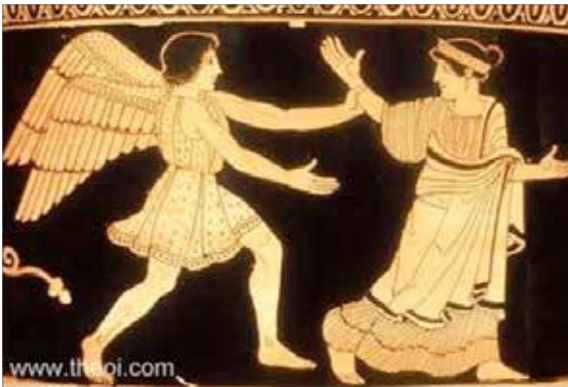
Boreas schaakt Oreithya

We keken reeds enige tijd uit naar een wat grotere boot. Een Trintella 1 is een prachtig schip, maar het is wel prettig om s'avonds rechtop in je kooi een boek te kunnen lezen, dixit mijn vrouw. Ik veinsde onverschilligheid (had toen ook wel wat anders aan mijn hoofd) en zo kwamen we in november 2009 uit op een Trintella 3, de "Chione". Buiten de genoegens van een nieuwe boot biedt dit ook de gelegenheid tot een eventuele naamsverandering. "Chione" was niet meteen mijn ding, klinkt een beetje Grieks-mythologisch, maar deed niet meteen een belletje rinkelen, ondanks mijn klassieke opleiding. Je boot een nieuwe naam kunnen geven heeft ook iets psychologisch: je drukt je stempel op je bezit, dit is van mij en/of dit ben ik; je geeft iets van jezelf mee. Bovendien waren wij er ons ook van bewust dat dit volgens een vast