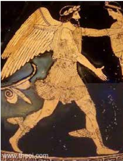
Boreas met ijskristallen in baard

Oreithya is de godin van de bergwind en van oorsprong een prinses, dochter van