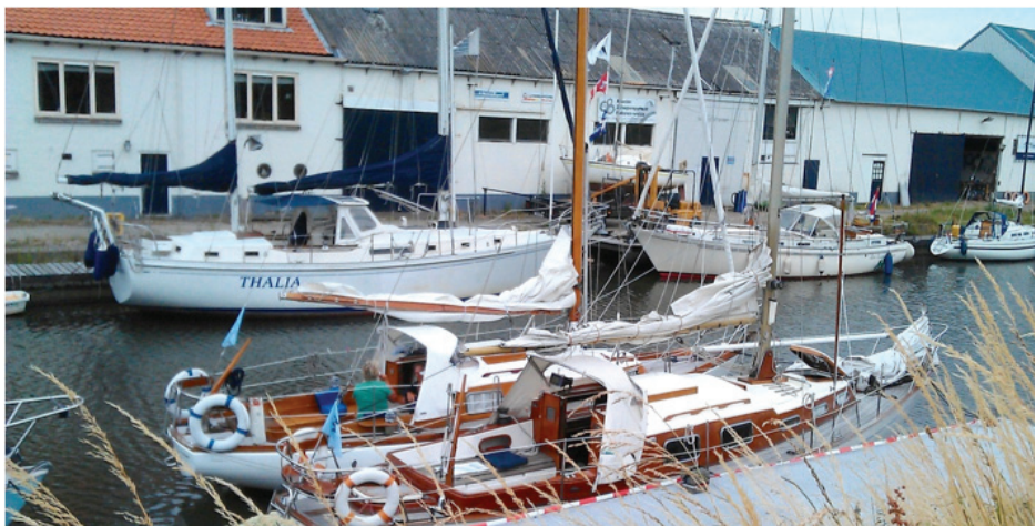
De twee deelnemende Trintella's (Achtergrond: Trintella 3, de Luie Kikker geen deelnemer)

Na het palaver om 09.30 uur, vertrok de vloot om ca. 11.00 richting startschip naast de haveningang van Middelharnis. Na de nodige kanonschoten en vlagwisselingen door de wedstrijdcommissaris aan boord van zijn "Marretje" vertrok de vloot met een 2 Bft uit het NW over de startlijn in noordelijke richting. Er was een interessante tocht uitgezet waarbij alle zeilstanden aan bod kwamen. Meest interessant was het 'melkmeisje', waarbij de voordekkers speciale taken kregen om de te korte pikhaak als fokkeboom toe te passen. Al snel werd duidelijk dat de Trintella's nooit op snelheid bij weinig wind zijn ontworpen, maar op vele andere prachtige kwaliteiten. In combinatie met enige onoplettendheid, of zo je wilt eigenwijsheid, pakte mijn tactiek helemaal verkeerd uit waardoor ik achteraan in het veld kwam. We hadden zodoende wel een prachtig overzicht op het wedstrijdveld en hoefden niet steeds achterom te kijken. Na een paar uur zeilen kwamen we in windstiltes terecht, waarna een lichtelijke wanhoop zich ons meester maakte. Na marifoon contact met de wedstrijdleiding werd duidelijk dat we in de bekende "dolldrums" op het Haringvliet waren beland. We kregen permissie om met andere achterblijvers een verkorte baan naar de "Marretje" te varen om af te melden.