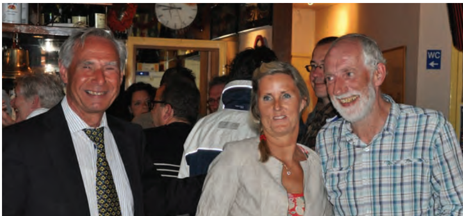
Voorjaarsbijeenkomst 2012: gezelligheid in het restaurant van de jachtclub