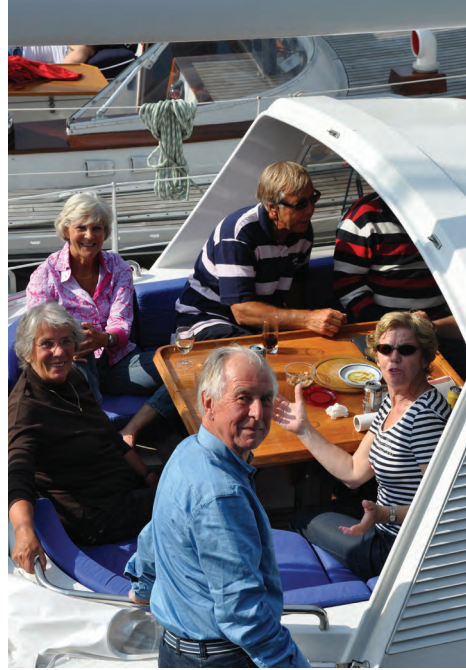
Aan boord van de Talisman