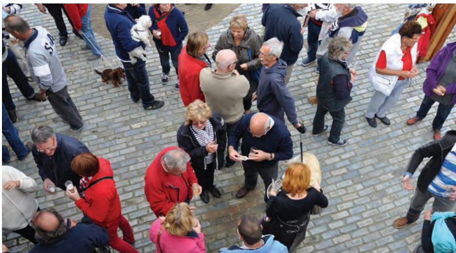
Voorjaarsbijeenkomst 2012: ontvangst met oesters en champagne!