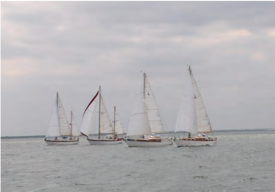
Close finish in de wedstrijd