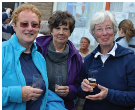
Voorjaarsbijeenkomst 2012: proost met bubbeltjes!