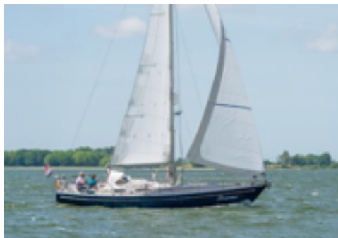
Een zeilgroet van Jouwert de Vries & Ineke Westendorp vanuit de "Doarmer" (Breehorn 37)

Wat een VRIJHEID en RUST op het water. Iedereen een fijne (gezonde) zomer toegewenst!