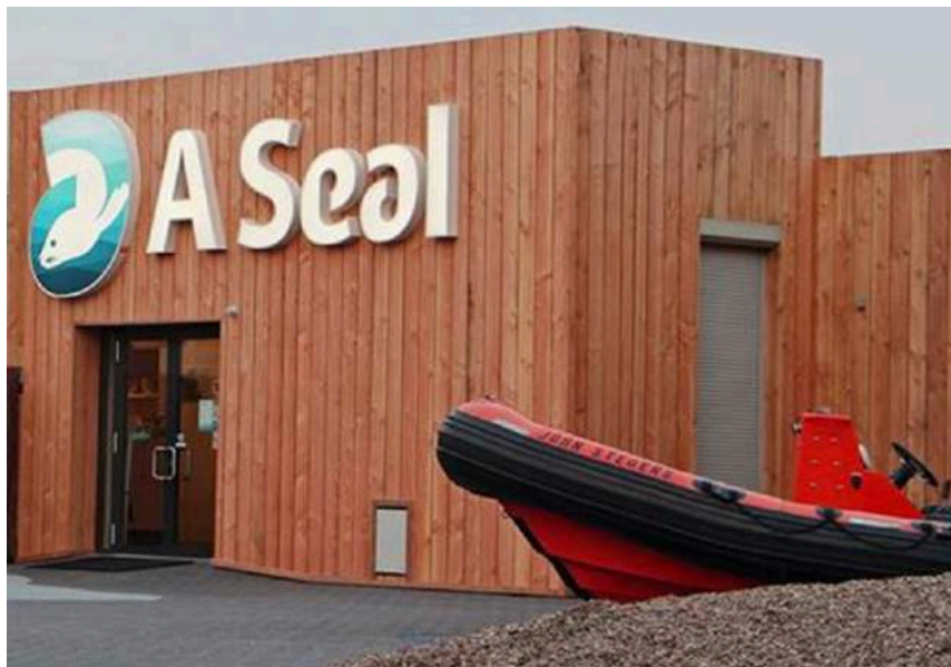
Zeehondenopvangcentrum A Seal

en aan de catacomben van de Haringvlietdam (onder voorbehoud van medewerking van RWS).