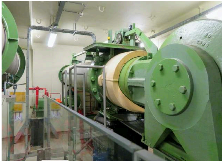
De machinekamer van de sluis

Het afsluitende buffet gebruiken we in het restaurant van de haven, met uitzicht op onze schepen.