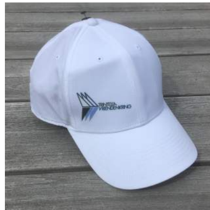
Nike € 23,50

Wir haben uns entschieden, die Lieferung des Trintella-Geschirrs über den TVK einzustellen. Das Sortiment ist weiterhin in unserem Katalog zu finden, aber ab