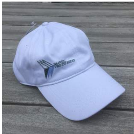
Cool Cap € 10,50

Auf vielfachen Wunsch: Die TVK-Kappen sind wieder im Sortiment, in zwei Qualitäten. Schauen Sie sich unser Shop-Sortiment im Katalog auf der Internetseite an.