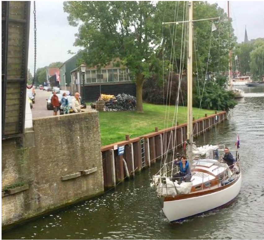
De Windweer met bemanning in de Binnenhaven