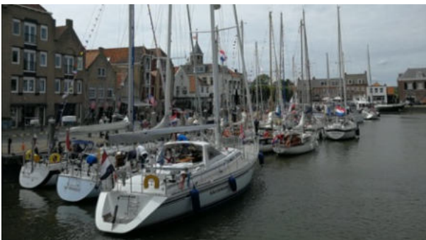
De Trintellavloot in de oude haven van Willemstad

Het TVK-weekend werd op 26 mei, Hemelvaartsdag, afgetrapt in het prachtige Willemstad.