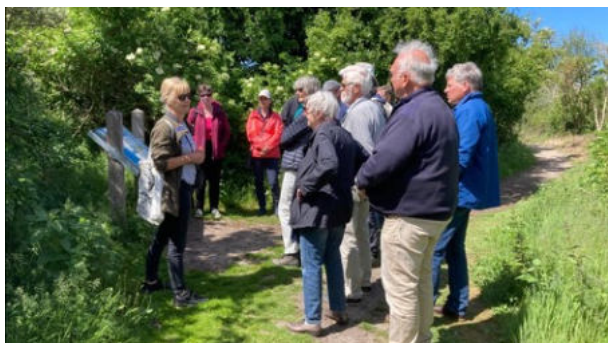
Aandacht voor de vogels

Er was de mogelijkheid om zeehondjes te kijken of met een gids een vogelobservatorium te bekijken.