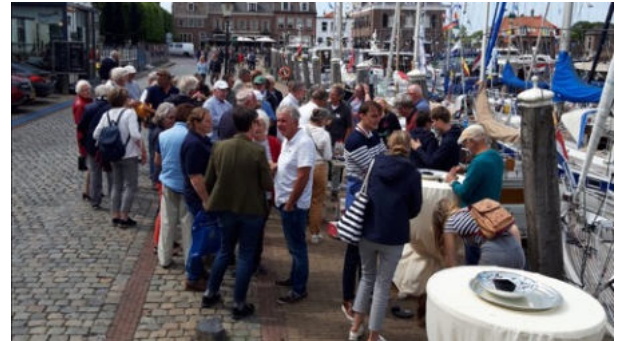
Borrelen op de kade van Willemstad

Hier begonnen we traditiegetrouw met een kadeborrel