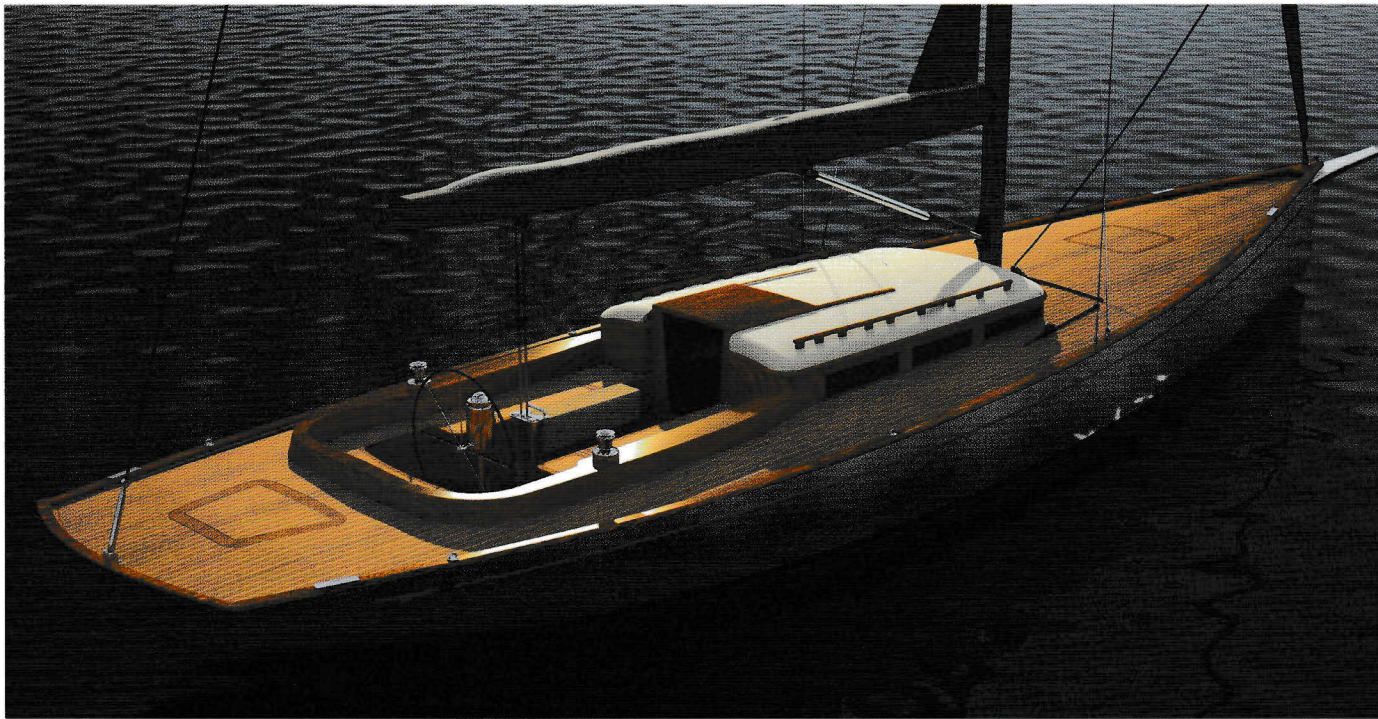
DE TRINTELLA 50, MET EEN STUURPOSITIE VAN WAARUIT ALLE BEDIENING ONDER HANDBEREIK IS.