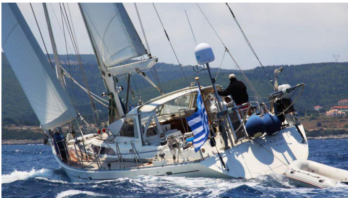
Trintella 57A uit de laatste serie Trintella jachten naar ontwerp van Van de Stadt

Helms lacht. “Je ziet van alles voorbijkomen op die bijeenkomsten. Van kleintjes tot een heel groot aluminium kasteel. Het maakt niet uit hoe oud je bent wat voor boot je hebt, iedereen gaat op dezelfde manier met elkaar om.”