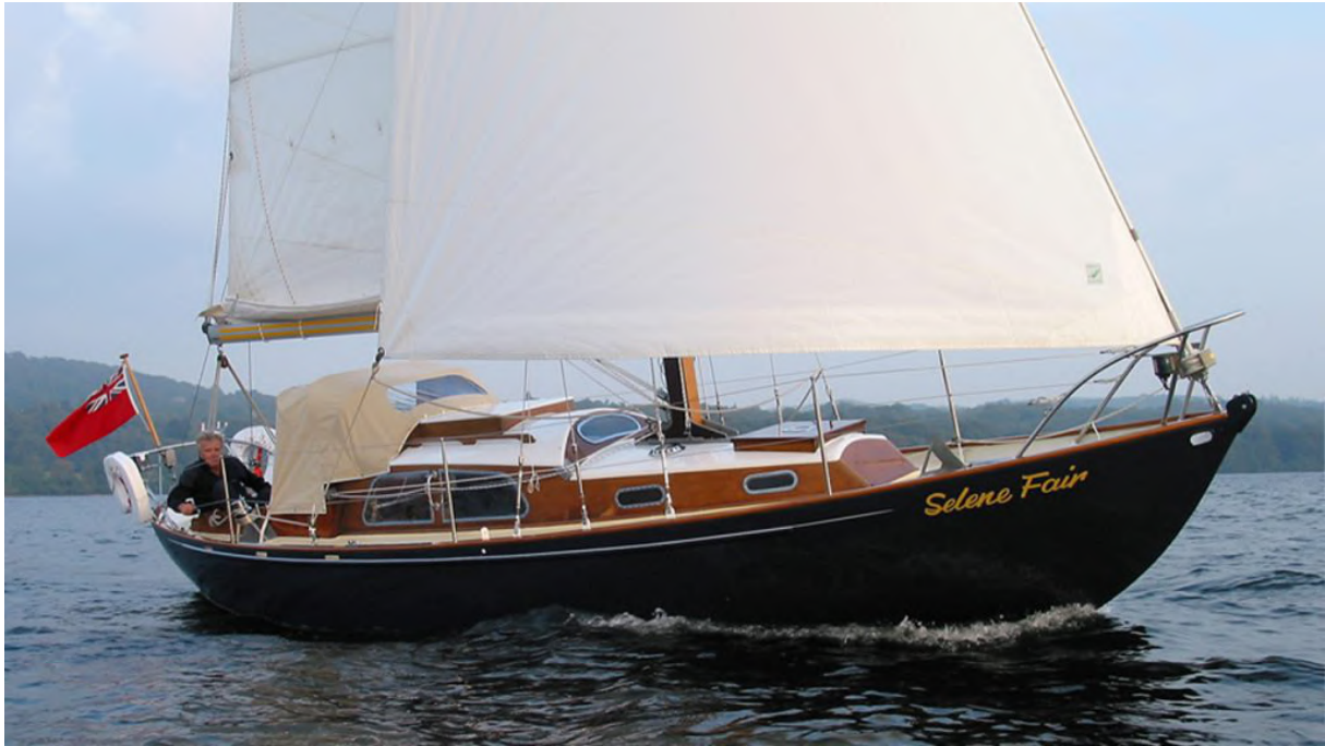
Een Trintel I