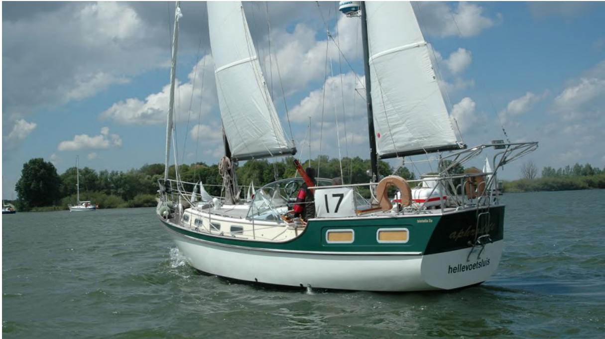
Een hele typische Trintella, de IIIa met grote achterkajuit en middenkuip

Het merendeel van al die leden heeft een herkenbare, typische Trintella met middenkuip, op de voet gevolgd door de klassiekers. Peter behoort zelf tot de leden zonder Trintella. Na al het schuurwerk stapte hij over op een Hallberg-Rassy. Ondanks de switch blijft hij gefascineerd door Trintella.