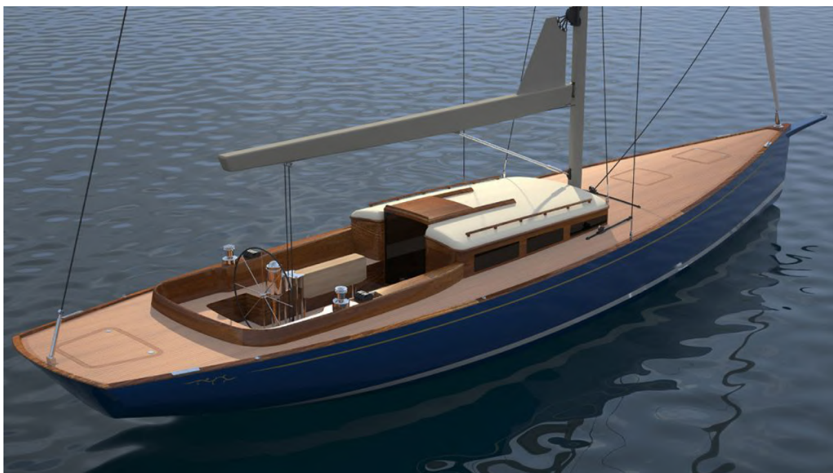
Een render van de Trintella 45.