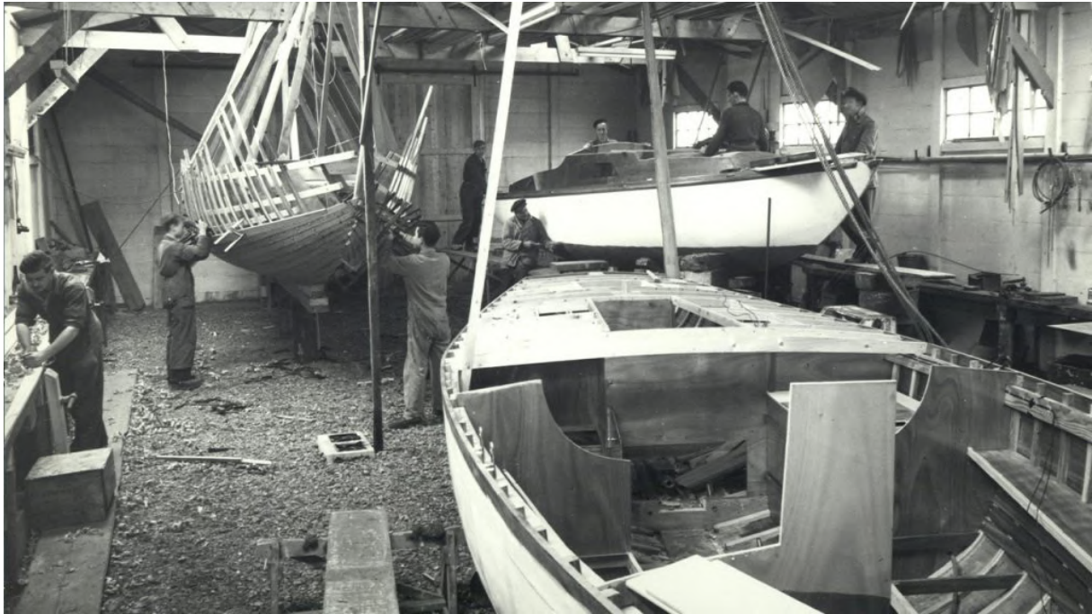
Boten in aanbouw op de Trintella-werf

Peter: “Voor het eerst was de volledige Trintella-portfolio goed geanalyseerd. Types werden niet meer door elkaar gehaald en het merk wordt grondig in kaart gebracht. Daarnaast houdt Peter zich ook nog bezig met het jaarlijkse magazine van de vereniging, barstensvol informatie. “Ja, daarmee hebben we een goede stap voorwaarts gemaakt.”