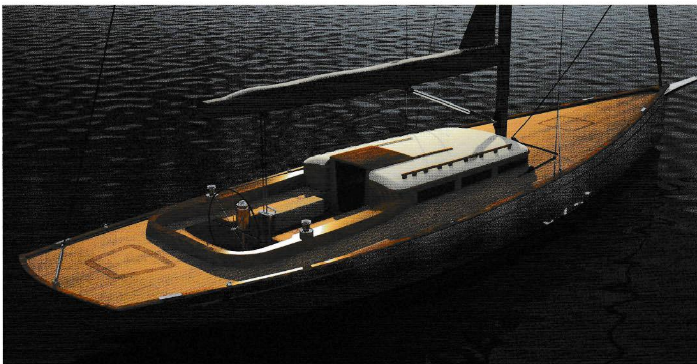
DE TRINTELLA 50, MET EEN STUURPOSITIE VAN WAARUIT ALLE BEDIENING ONDER HANDBEREIK IS.