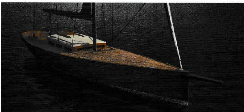
DE TRINTELLA 45 MET FRAAIE ZEEG. OOK HIER WEER EEN 'MODERN KLASSIEKE' STYLING.

geen nerveuze racer. De rondspant romp is voorzien van een balansroer – het stuursysteem is van Jefa – en een kiel met T-bulb, voorzien van loodballast.